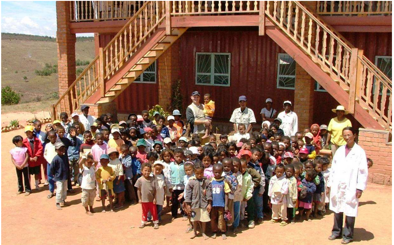
Lundi 22 Sept. 2008 / Rentrée officielle et répartition des classes...

Nous avons 168 élèves inscrits pour 6 instituteurs, de la Grande Section jusqu'au CM1 nouvellement créé pour permettre aux CE de l'année dernière de poursuivre leur scolarité à LMA.