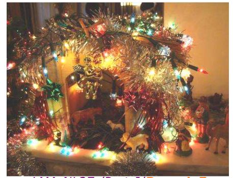
LMA-NL27 /Part-I/Page 1-5

Arrivée en famille Lundi 21 Février 2005 / 1411 ième jour à Madagascar !